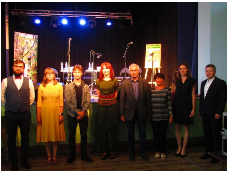
Laureaci konkursu o „Cisową gałązkę”

4 września biblioteka włączyła się do ogólnopolskiej akcji Narodowego Czytania, podczas której czytelnicy czytali z podziałem na role „Moralność pani Dulskiej” Gabrieli Zapolskiej.