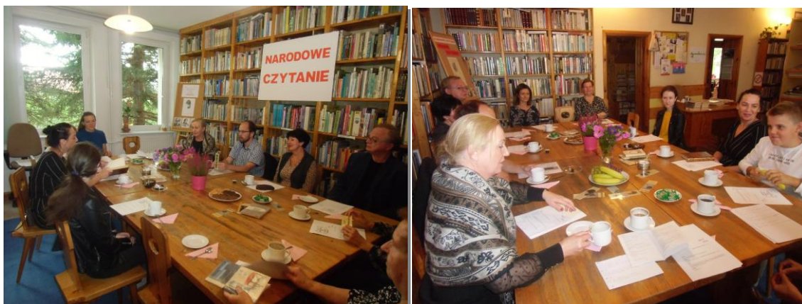
Uczestnicy „Narodowego Czytania” w cekcyńskiej bibliotece

4 września biblioteka włączyła się do ogólnopolskiej akcji Narodowego Czytania, podczas której czytelnicy czytali z podziałem na role „Moralność pani Dulskiej” Gabrieli Zapolskiej.