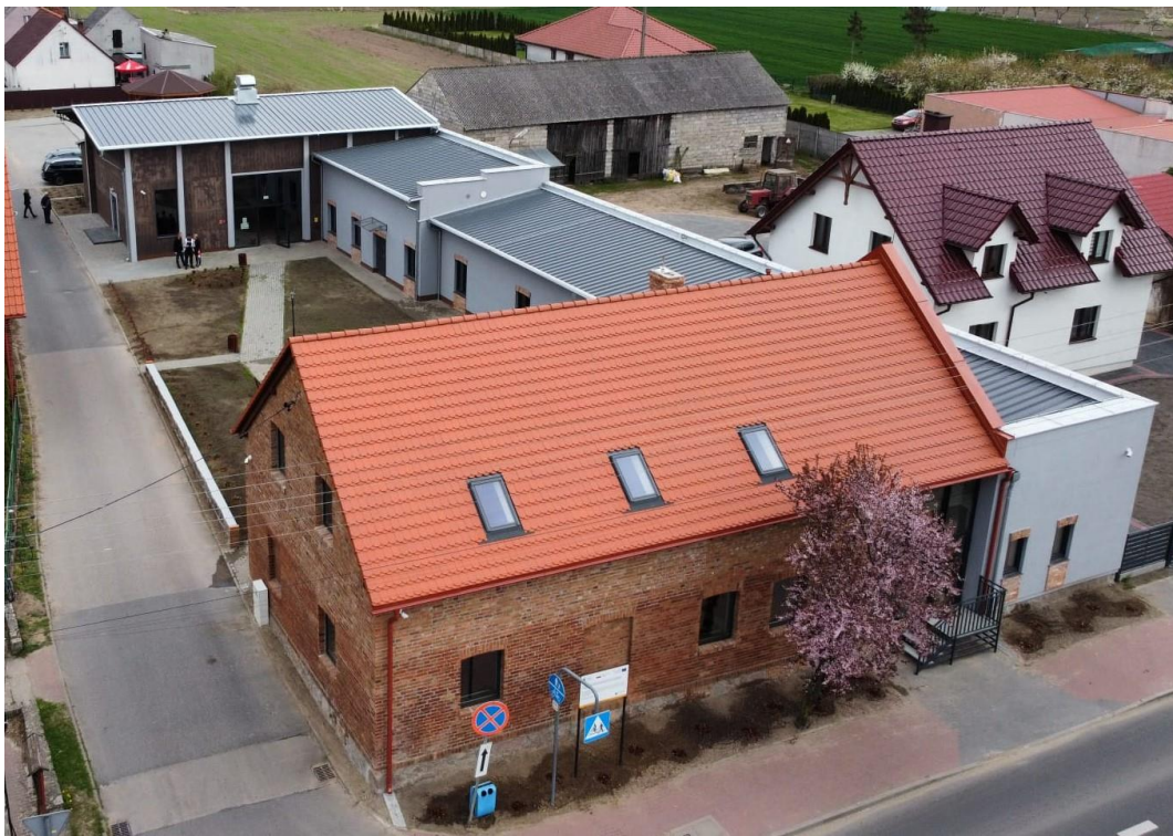
Widok na Centrum Usług Społecznych przy ul. Wczasowej 14 w Cekcynie

2016-2023 „Dekel do borowiackiej grapy” , wdrażanej przez Partnerstwo „Lokalna Grupa Działania Bory Tucholskie”.